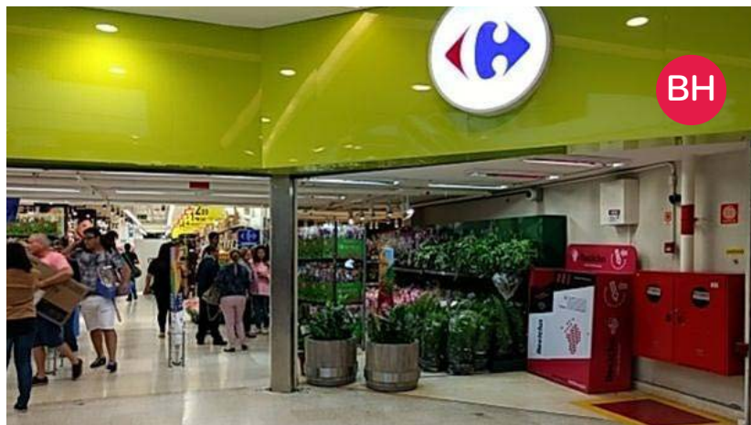
Carrefour BH Shopping – Belo Horizonte (MG)