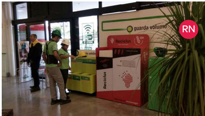
Leroy Merlin – Natal (RN)