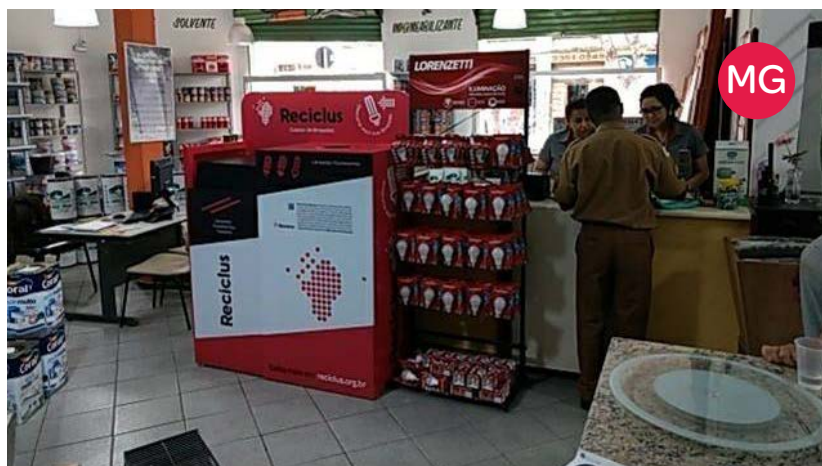
Depósito Rio Verde – Contagem (MG)